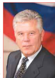
Павел ИПАТОВ, губернатор Саратовской области

Уважаемые жители Саратовской губернии! Поздравляю вас с юбилеем Великой Победы, с 9 мая!