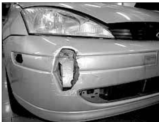
До и после ремонта

Царапина – самое простое повреждение. В любой гаражной мастерской царапину зашкурят, зашпаклюют и покрасят. Будет вполне даже презентабельно. Эту процедуру опытные автолюбители при наличии элементарных навыков могут проводить и самостоятельно. Самое главное – хорошо обезжирить поверхность перед покраской, поскольку грязь очень коварна и имеет способность глубоко впитываться в старую краску. Нюансы проведения ремонта достаточно много, поэтому лучше все же не проводить экспериментов,